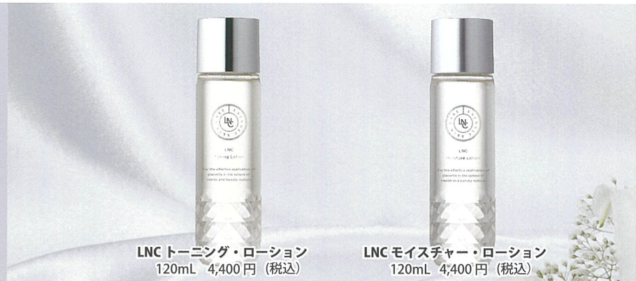
LNC トーニング・ローション 120mL 4,400円 (税込)