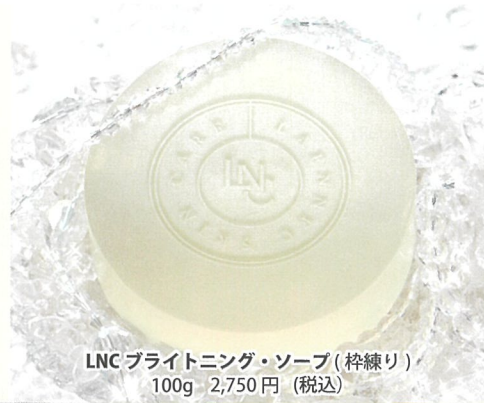
LNC ブライトニング・ソープ (粹練り) 100g 2,750円 (税込)