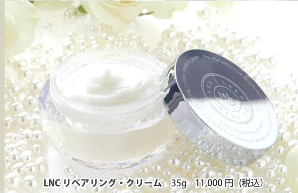
LNC リペアリング・クリーム 35g 11,000円 (税込)