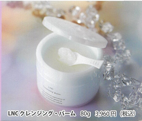
LNC クレンジング・バーム 80g 3,960円 (税込)