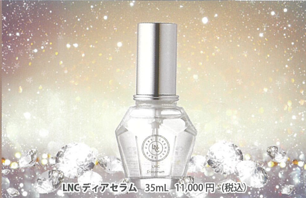
LNC ディアセラム 35mL 11,000円 (税込)