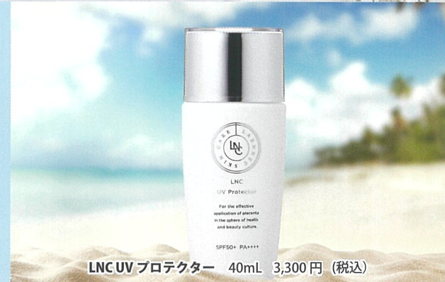
LNC UV プロテクター 40mL 3,300円 (税込)